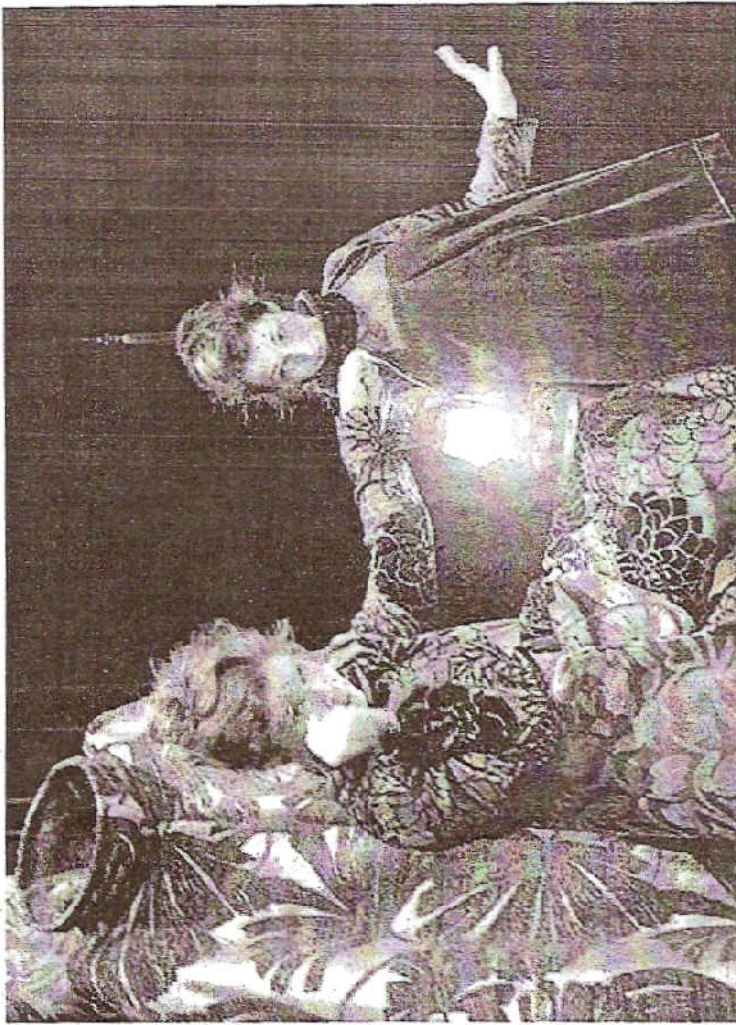
Dans une maison abandonnée de Normandie, pour tuer le temps, deux vieilles cousines font un concours d'histoires à faire peur.

Les douze coups de minuit, solennels, résonnent dans la maison hantée des deux cousines qui font dans la surenchère des histoires d'outre-tombe. Brrr ! J'ai peur... Fantômes et esprits revenus sur terre interpellent les vivants oubliés des devoirs et du respect dus aux trépassés. Des personnages sortent des ta-